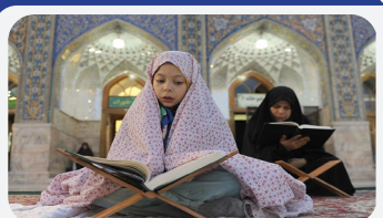
قرآن و زیست مؤمنانه؛ بازخوانی نقش آیات در زندگی امروز