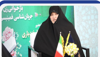
وظیفه امروز، تجمع حول محور جانشین ولایت است