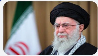
شهادت امام خامنه ای آتش ایمان و عشق به وطن را در دلها شعله ورتر می کند