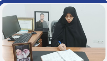
اتحاد مقدس، تجلی تمسک به جبل الله در میدان انسجام ملی است